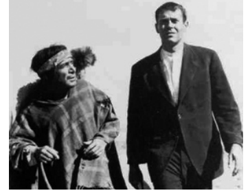
1947 DIEU EST MORT (The Fugitive) de John Ford avec Henry Fonda