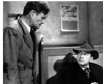
1944 LE SIFFLEUR (The Whistler) de William Castle avec Richard Dix