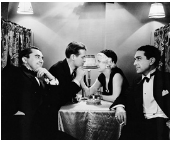
1931 LA BÊTE DE LA CITÉ (The Beast of the City) de Ch. Brabin avec J. Hersholt, W. Ford, Jean Harlow