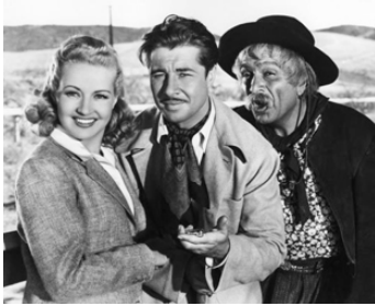
1940 SOUS LE CIEL D'ARGENTINE (Down Argentine Way) d'I. Cummings avec B. Grable, Don Ameche