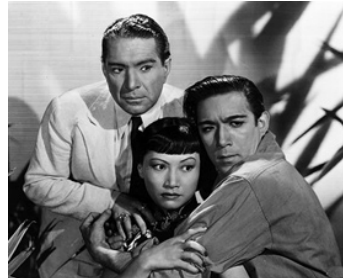
1939 L'ÎLE DES HOMMES PERDUS (Island of Lost Men) de K. Neumann avec A. Quinn, A.M. Wong