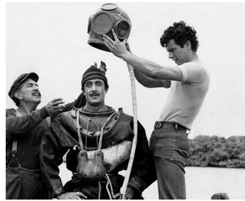
1953 TEMPÊTE SOUS LA MER (Beneath the 20 mile reef) de R. Webb avec Gilbert Roland, R. Wagner