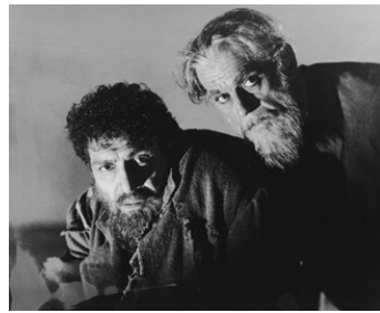
1944 LA MAISON DE FRANKENSTEIN (House of Frankenstein) d'Erle C. Kenton avec Boris Karloff