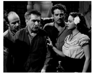
1945 A MEDAL FOR BENNY d'Irving Pichel avec Grant Mitchell, Dorothy Lamour