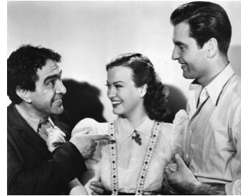
1941 ACCENT OF LOVE de Ray McCarey avec Osa Massen, George Montgomery