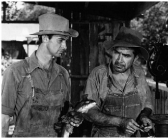
1945 L'HOMME DU SUD (The Southerner) de Jean Renoir avec Zachary Scott