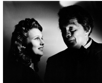
1942 LE SECRET DU Dr RENAULT (Dr Renault's Secret) de Harry Lachman avec Lynne Roberts