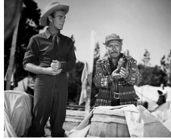
1949 CANADIAN PACIFIC (Canadian Pacific) d'Edwin L. Marin avec Randolph Scott