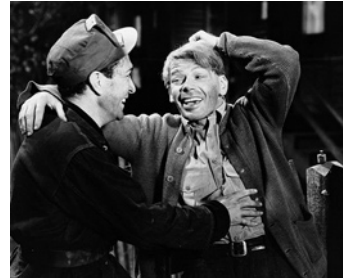
1934 FURIE NOIRE (Black Fury) de Michael Curtiz avec Paul Muni