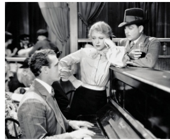
1932 JENNY FRISCO (Frisco Jenny) de William A. Wellman avec Donald Woods, Ruth Chatterton