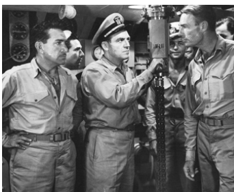
1943 L'HÉROÏQUE AVENTURE (Gung Ho !) de Ray Enright avec Allan Curtis, Randolph Scott