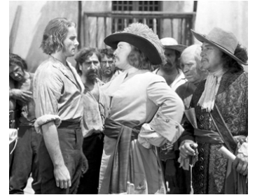
1935 CAPITAINE BLOOD (Captain Blood) de M. Curtiz avec Errol Flynn, Lionel Atwill