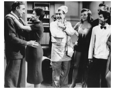
1957 CETTE NUIT OU JAMAIS (This could be the Night) de Robert Wise avec Paul Douglas, Jean Simmons