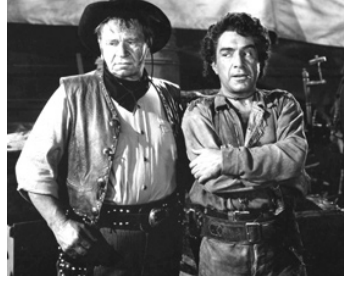
1946 L'ANGE ET LE BANDIT (Bad Bascomb) de S. Sylvan Simon avec Wallace Beery