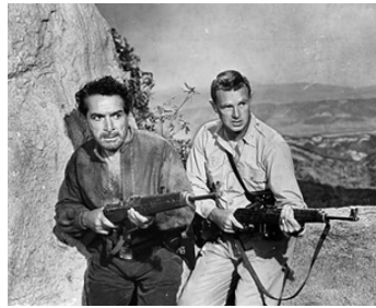
1953 GROUPE DE COMBAT (Fighter Attack) de Lesley Selander avec Sterling Hayden