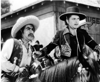
1935 ROBIN DES BOIS D'EL DORADO (Robin Hood of El Dorado) de W. Wellman avec Warner Baxter