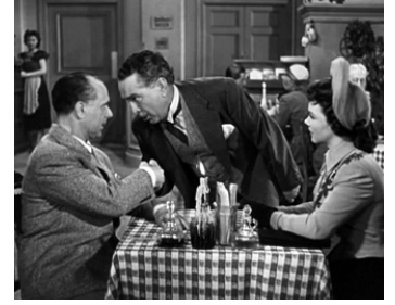
1949 LE BAISER DE MINUIT (That Midnight Kiss) de N. Taurog avec José Iturbi, Katherine Grayson