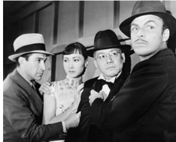
1937 LA FILLE DE SHANGHAÏ (Daughter of Shanghai) de R. Florey avec Anna May Wong, Ph. Ahn