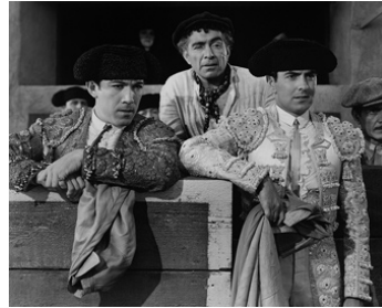
1941 ARÉINES SANGLANTES (Blood and Sand) de R. Mamoulian avec A. Quinn, Tyrone Power