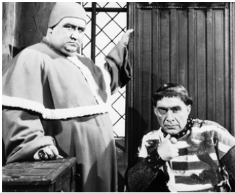
1948 JEANNE D'ARC (Joan of Arc) de Victor Fleming avec Francis O'Sullivan