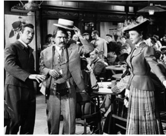
1950 LE CHANT DE LA LOUISIANE (The Toast of New Orleans) de N. Taurog avec M. Lanza, K. Grayson