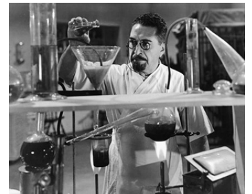
1944 CRÉATEUR DE MONSTRES (The Monster Makers) de Sam Newfield