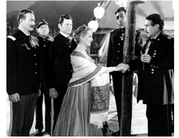
1950 RIO GRANDE (Rio Grande) de John Ford avec J. Wayne, V. McLaglen, M. O'Hara