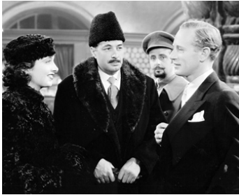
1934 BRITISH AGENT de Michael Curtiz avec Kay Francis, Leslie Howard