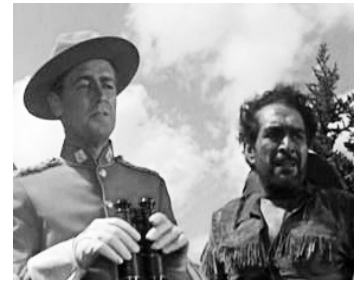
1953 LA BRIGADE HÉROÏQUE (O'Rourke of the Royal Mounted) de Raoul Walsh avec Alan Ladd