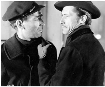
1944 LA BATAILLE DE L'EAU (Waterfront) de Steve Sekely avec John Carradine