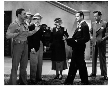
1933 THE LAST TRAIL de James Tinling avec G. O'Brien, LeRoy Mason, Claire Trevor, G. Reed