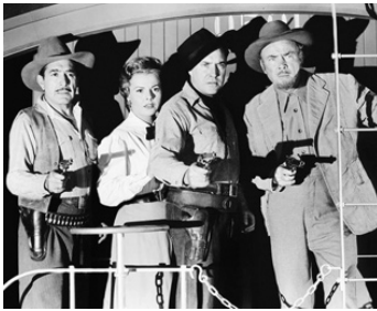
1952 LES RIVAUX DU RAIL (Denver and Rio Grande) de B. Haskin avec K. Rogers, E. O'Brien, D. Jagger