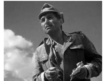
1943 LES DIABLES DU SAHARA (Sahara) de Zoltan Korda