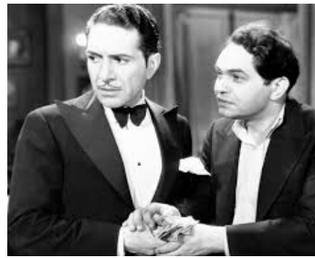
1932 DEUX SECONDES (Two Seconds) de Mervyn LeRoy avec Edward G. Robinson