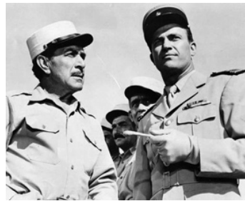
1955 LE BATAILLON DES CONDAMNÉS (Desert Sands) de Lesley Selander avec Ralph Meeker