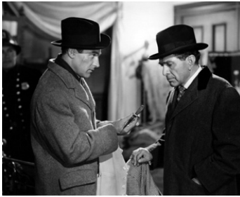
1949 LA MAIN NOIRE (Black Hand) de Richard Thorpe avec Gene Kelly