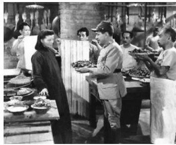
1944 LES FILS DU DRAGON (Dragon Seed) d'H. Bucquet et J. Conway avec K. Hepburn