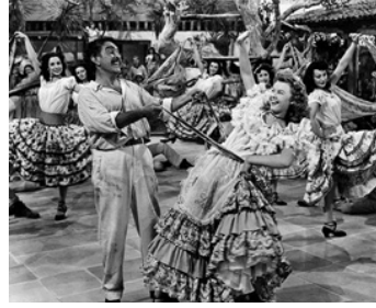
1947 CARNIVAL AU COSTA-RICA (Carnival in Costa Rica) de Gregory Ratoff avec Vera-Ellen