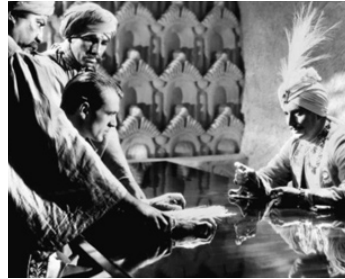
1934 LES 3 LANCIERS DU BENGAL (The Lives of a Bengal Lancer) de H. Hathaway avec G. Cooper