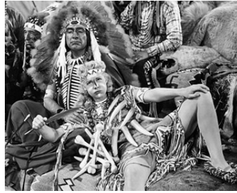
1950 ANNIE REINE DU CIRQUE (Annie get your gun) de George Sidney avec Betty Hutton