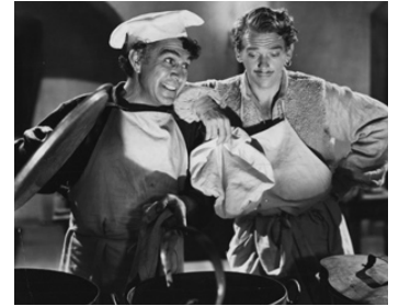
1941 VENDETTA (The Corsican Brothers) de Gregory Ratoff avec Douglas Fairbanks Jr