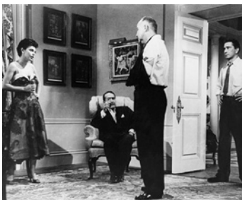
1954 NEW YORK CONFIDENTIAL de Russell Rouse avec Anne Bancroft, Richard Conte