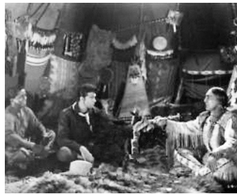
1954 SITTING BULL (Sitting Bull) de Sidney Salkow avec Dale Robertson