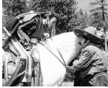
1948 LE BRIGAND AMOUREUX (The kissing Bandit) de Laszlo Benedek avec Frank Sinatra