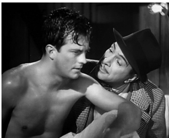
1942 SUNDAY PUNCH de David Miller avec William Lundigan